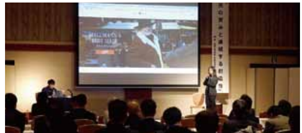
▲第2部講演「蔵元の営みと連続する創造性」

性」と題し、地元秋田の味噌醤油醸造蔵元の奮闘と、伝統産業にアートやデザインを融合させたブランディングについてご講演頂きました。またこの講演で紹介された醤油などは会場内の物産展でも販売され、多くの参加者が買い求めていました。