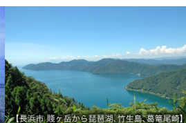
【長浜市 膳ヶ岳から琵琶湖、竹生島、曇竜尾崎】