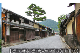
【近江八幡市 近江商人の街並み(新町通り)】